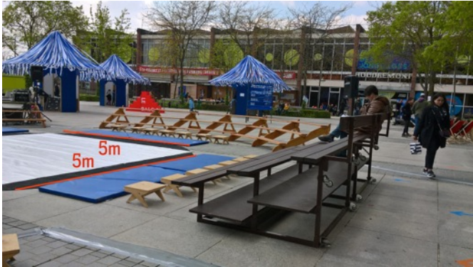
Configuration de jour avec gradin