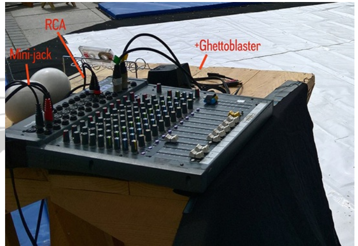
Régie au plateau