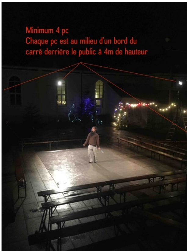
Configuration de nuit avec gradin