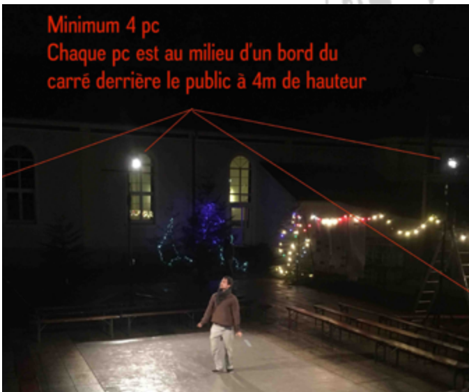
Configuration de nuit avec gradin

Cette fiche technique a été établie le 17 juillet 2019, elle remplace et annule la précédente. Elle fait partie intégrante du contrat. Des modifications peuvent être faites dues aux spécificités du lieu d'accueil uniquement après discussion avec la compagnie.