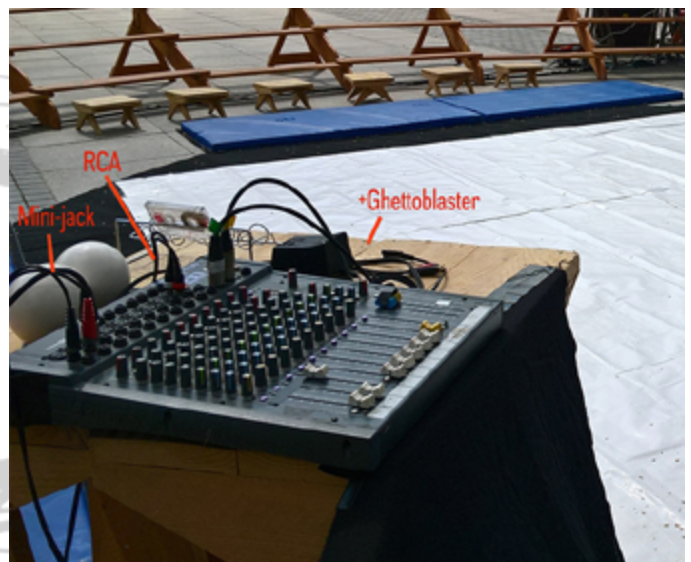
Régie au plateau