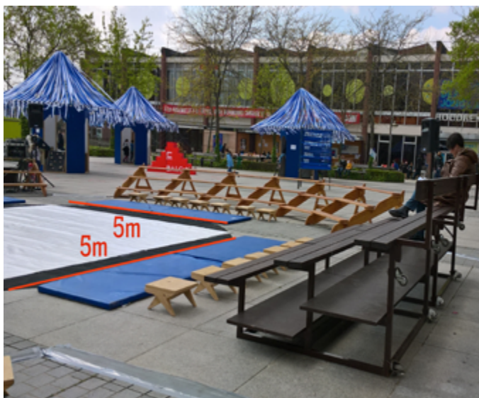
Configuration de jour avec gradin