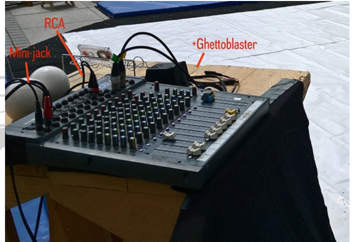
Régie au plateau